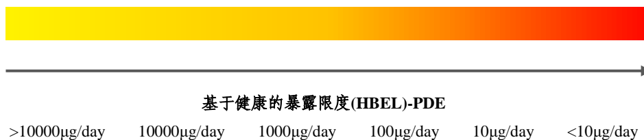
图 1.1: 基于健康的暴露限度危害递增示意图

（2）在使用 PDE 或 ADE 值时，按照以下危害递增原则建立标准并对产品进行评估：